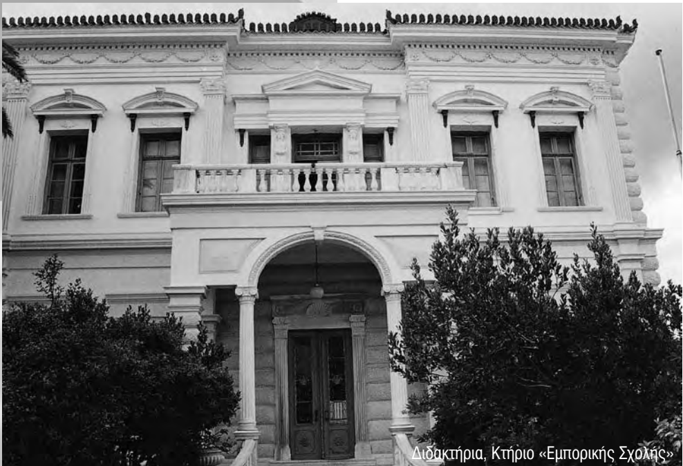
Διδακτήρια, Κτήριο «Εμπορικής Σχολής»

Ο Οδηγός αυτός περιέχει όλες τις απαραίτητες πληροφορίες που αφορούν τόσο τους σημερινούς όσο και τους μελλοντικούς φοιτητές του Τμήματος.