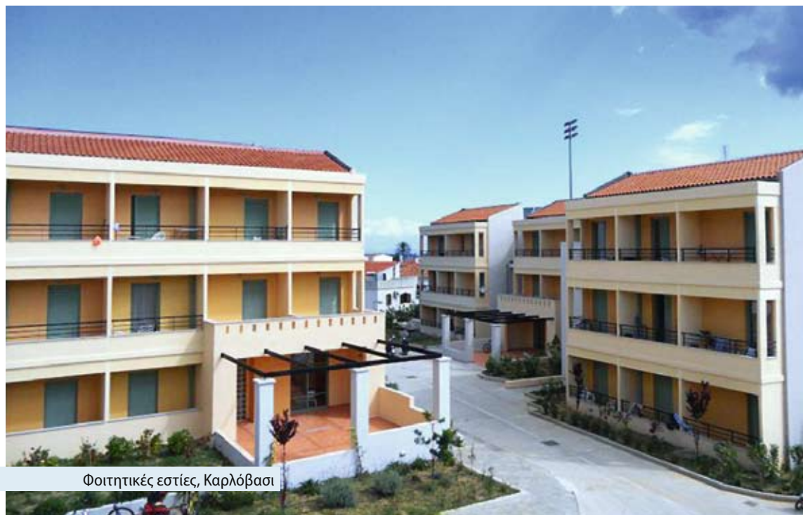
Φοιτητικές εστίες, Καρλόβασι

Αξιοποιώντας σχετικές χρηματοδοτικές δυνατότητες της Ευρωπαϊκής Επιτροπής μέσω των προγραμμάτων ERASMUS / SOCRATES, το Τμήμα ανέπτυξε και διατηρεί εκπαιδευτικές και ερευνητικές συνεργασίες με πολλά Ευρωπαϊκά Πανεπιστήμια. Ενδεικτικά αναφέρονται τα ακόλουθα: Royal Holloway and Bedford New College (University of London), University of Plymouth, University College Dublin, Aston University, Kingston University, Trinity College Dublin, University of Stockholm, University of Lund, Chalmers Institute of Technology, Karlstad University, University of Hamburg, University of Essen, University of Regensburg, Catholic University of Leuven, University of Vienna, Technical University of Graz, University of Oulu, University of Rome "La Sapienza", University of Milano, Deusto University, University of Malaga, Polytechnic University of Catalunya, Copenhagen Business School, κ.α.