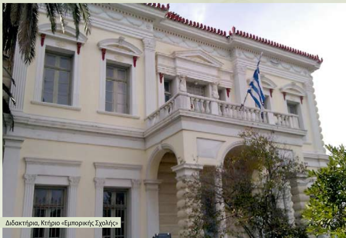
Διδακτήρια, Κτήριο «Εμπορικής Σχολής»