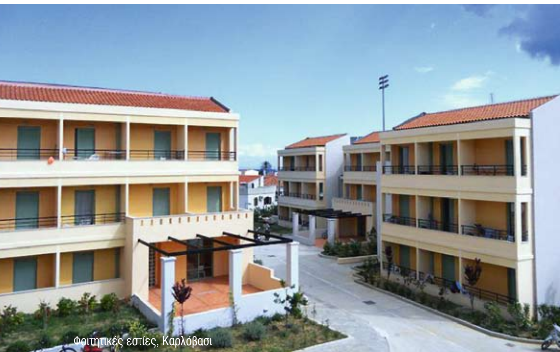
Φοιτητικές εστίες, Καρλόβασι

Το Πανεπιστήμιο Αιγαίου αναπτύσσεται σταθερά, με μεθοδικότητα, σύμφωνα με τα Στρατηγικά Σχέδια και τα Πενταετή Αναπτυξιακά Προγράμματα που εκπονεί. Στα προγράμματα αυτά αποτυπώνονται οι αποκτημένες εμπειρίες, τόσο για τις δυσκολίες λειτουργίας Πανεπιστημιακών Τμημάτων σε ακριτικά νησιά, όσο και για την επικοινωνία μέσα σε ένα Πανεπιστήμιο-δίκτυο, το οποίο λειτουργεί υπό τις ιδιαίτερες συνθήκες του Ελληνικού Αρχιπελάγους. Οι εμπειρίες αυτές οδήγησαν το Πανεπιστήμιο Αιγαίου να είναι το πρώτο Ελληνικό Πανεπιστήμιο που έχει πλήρως εντάξει τις Τεχνολογίες Πληροφορικής και Επικοινωνιών στην καθημερινή του ευρεία διοικητική πρακτική, υλοποιώντας έτσι, στο βαθμό που του αναλογεί, τις προϋποθέσεις ανάπτυξης της Κοινωνίας της Πληροφορίας και της Γνώσης.