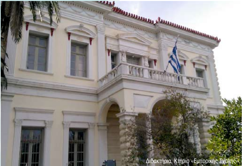
Διδακτήρια, Κτήριο «Εμπορικής Σχολής»

Ο Οδηγός αυτός περιέχει όλες τις απαραίτητες πληροφορίες που αφορούν τόσο τους σημερινούς όσο και τους μελλοντικούς φοιτητές του Τμήματος.