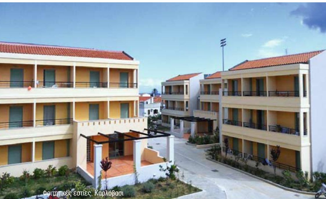
Φοιτητικές εστίες, Καρλόβασι

Το Πανεπιστήμιο Αιγαίου αναπτύσσεται σταθερά, με μεθοδικότητα, σύμφωνα με τα Στρατηγικά Σχέδια και τα Πενταετή Αναπτυξιακά Προγράμματα που εκπονεί. Στα προγράμματα αυτά αποτυπώνονται οι αποκτημένες εμπειρίες, τόσο για τις δυσκολίες λειτουργίας Πανεπιστημιακών Τμημάτων σε ακριτικά νησιά, όσο και για την επικοινωνία μέσα σε ένα Πανεπιστήμιο-δίκτυο, το οποίο λειτουργεί υπό τις ιδιαίτερες συνθήκες του Ελληνικού Αρχιπελάγους. Οι εμπειρίες αυτές οδήγησαν το Πανεπιστήμιο Αιγαίου να είναι το πρώτο Ελληνικό Πανεπιστήμιο που έχει πλήρως εντάξει τις Τεχνολογίες Πληροφορικής και Επικοινωνιών στην καθημερινή του ευρεία διοικητική πρακτική, υλοποιώντας έτσι, στο βαθμό που του αναλογεί, τις προϋποθέσεις ανάπτυξης της Κοινωνίας της Πληροφορίας και της Γνώσης.