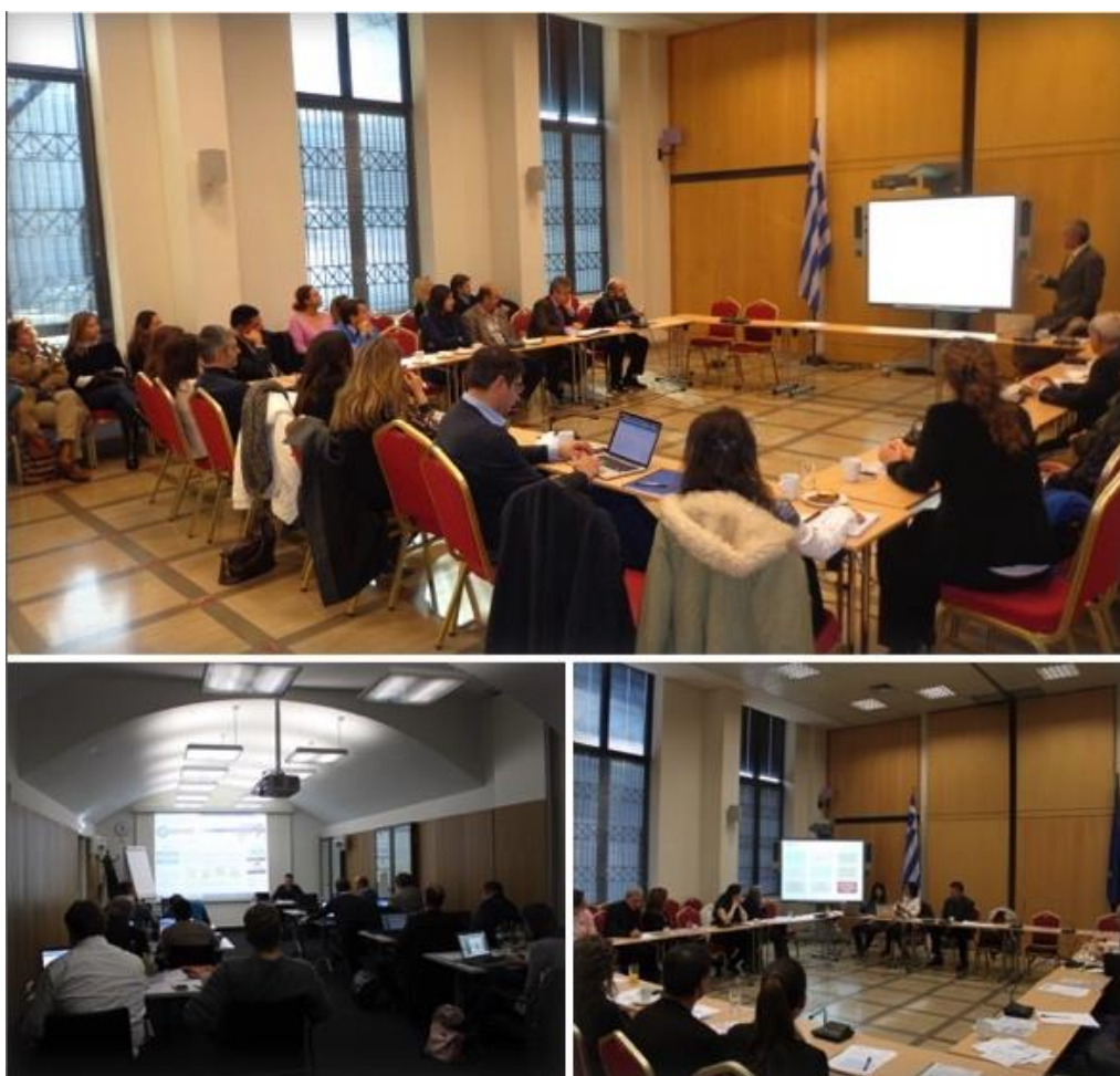
Παρουσίαση του NOMAD στο Ελληνικό και Αυστριακό Κοινοβούλιο

Η μεθοδολογία και τα εργαλεία του NOMAD, που αυτή τη στιγμή βρίσκονται στη φάση ολοκλήρωσης των, παρουσιάστηκαν και αξιολογήθηκαν σε τρεις διαδοχικές συναντήσεις, οι οποίες έλαβαν χώρα στο Ελληνικό και στο Αυστριακό Κοινοβούλιο (12, 18 και 25 Νοεμβρίου). Στις συναντήσεις αυτές συμμετείχαν συνολικά 60 άτομα, ανάμεσα τους κοινοβουλευτικά στελέχη, επιστημονικοί συνεργάτες βουλευτών και κομμάτων, δημοσιογράφοι, μέλη ΜΚΟ, σύμβουλοι επιχειρήσεων. Σημαντική ήταν η εκπροσώπηση του Ελληνικού δημόσιου τομέα, αφού παρευρέθηκαν φορείς όπως η Γενική Γραμματεία της Κυβέρνησης , η Γενική Γραμματεία Συντονισμού του Κυβερνητικού Έργου , 5 Υπουργεία ( Διοικητικής Μεταρρύθμισης , Αγροτικής Ανάπτυξης , Παιδείας , Δημόσιας Τάξης , Ναυτιλίας ), η Γενική Γραμματεία του Ελληνικού Κοινοβουλίου , ο Δήμος Αθηναίων , η συνεισφορά των οποίων ήταν η σημαντική στη συζήτηση για την υιοθέτηση και αξιοποίηση εργαλείων πληροφορικής όπως το NOMAD, στις καθιερωμένες διαδικασίες τους.